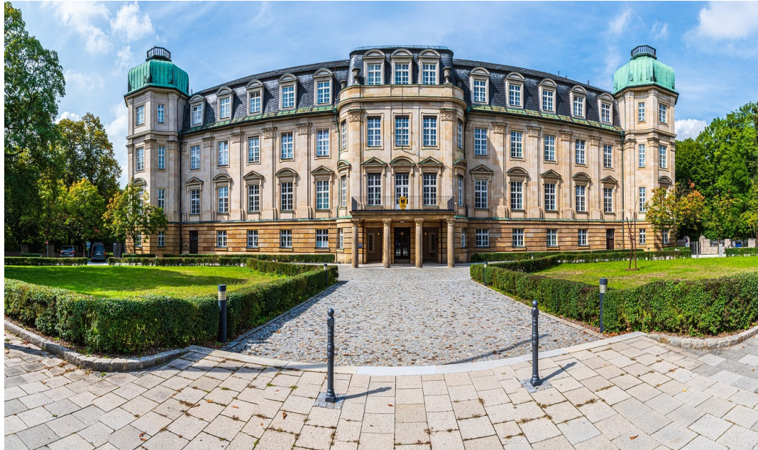
Bundesfinanzhof in München